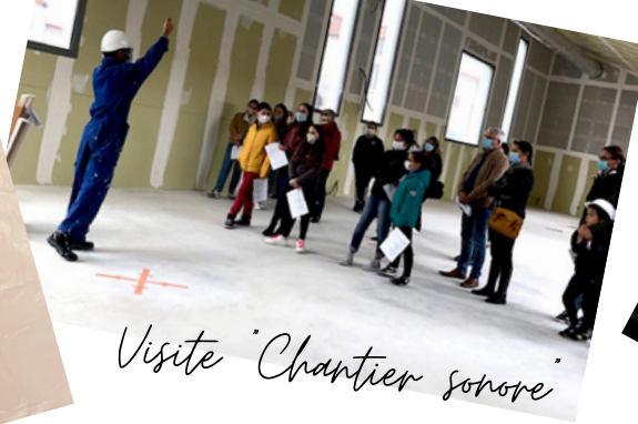
Visite "Chantier sonore"