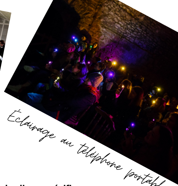
Éclairage au téléphone portable