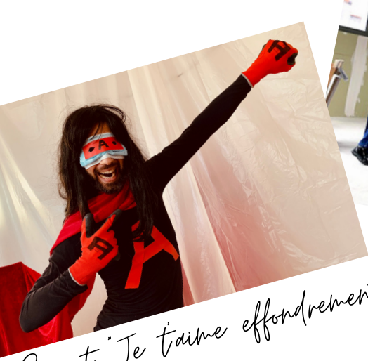
Spectacle "Je t'aime effondrement"