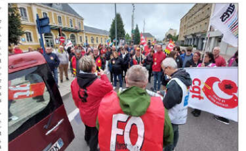
La manifestation s'est transformée en rassemblement.

« La manifestation s'arrête là », a annoncé la CGT au micro. « Certains de nos camarades sympathisants n'ont pas pu être là et il est fatigant très beau », a expliqué le syndicat. La CGT, FO, FSU et Solidaires étaient présents, mais aucun membre de la CFDT, CFE-CGC ou de la CGP n'est venu. Ainsi, les manifestants n'ont jamais quitté le parvis de la gare. « C'est dommage », regrette