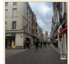
Le défilé devait avoir lieu place du Marché.

Le traditionnel défilé de mode organisé par les Vitrines de Roanne ce samedi après-midi est reporté. Il devait initialement avoir lieu sur la place du Marché où une soixantaine de mannequins étaient conviés pour présenter les vêtements et accessoires de nombreuses boutiques roanneises.